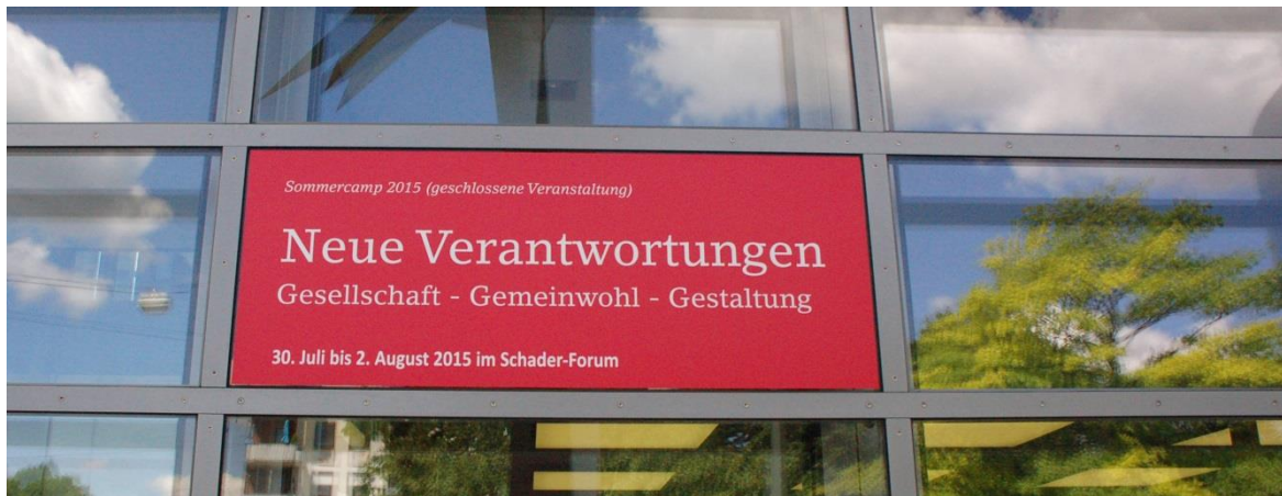
Abb. 1: Tagungshinweis „Neue Verantwortungen“

Zwanzig junge Menschen entwickelten von Donnerstag bis Sonntag Ende Juli, Anfang August 2015 im Schader-Forum Dialogprojekte. Unter dem Titel „Neue Verantwortungen – Gesellschaft, Gemeinwohl, Gestaltung“ hatten sie sich für das viertägige Sommercamp beworben und waren unter einer großen Anzahl von Mitbewerbern ausgewählt worden.